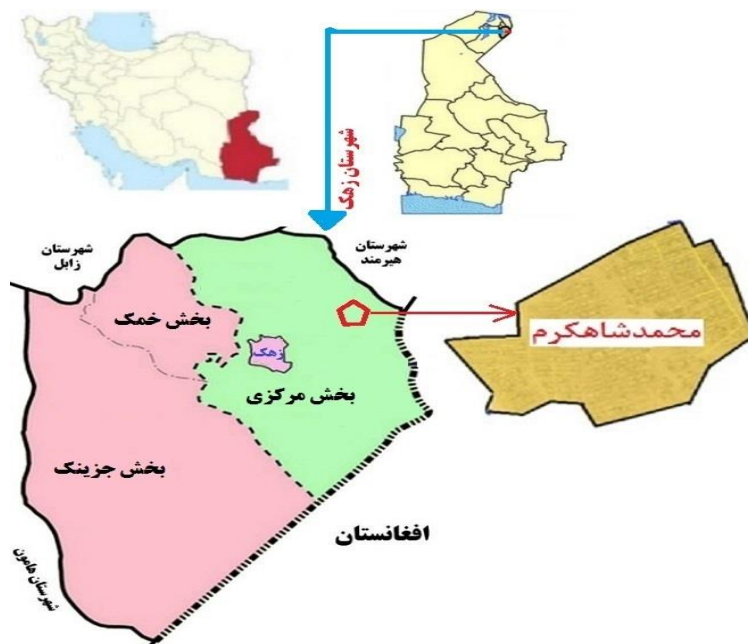
شکل ۱. موقعیت منطقه مورد مطالعه در کشور، استان و شهرستان

پژوهش حاضر از نوع کاربردی است که با روش پیمایش انجام شده و ابزار سنجش، پرسشنامه با دو نوع متغیر وابسته و متغیر مستقل بوده که شامل سوال‌های بسته و تعداد محدودی سوال باز بود و از حالت مقیاس چند درجه‌ای طیف لیکرت ۱ استفاده شد. این مقیاس از مجموعه‌ای از گویه‌ها تدوین شده است که به ترتیب خاصی ساخته می‌شود. پاسخ دهنده میزان موافقت خود را با هر یک از عبارات در یک مقیاس درجه‌بندی از یک تا پنج درجه نشان می‌دهد. سپس پاسخ آزمودنی‌ها به هر یک از گویه‌ها از نظر عددی ارزش‌گذاری و با حاصل جمع عددی این ارزش‌ها، نمره آزمودنی در این مقیاس به دست آمد (۲۲). روایی محتوایی پرسشنامه با استفاده از نظرات متخصصین تصحیح شد و برای تایید پایایی پرسشنامه، از ضریب آلفای کرونباخ (رابطه ۱) استفاده گردید که هر قدر شاخص آلفای کرونباخ به عدد یک نزدیک‌تر باشد همبستگی درونی بین سوالات یک پرسشنامه بیشتر و در نتیجه پرسش‌ها همگن‌تر خواهند بود جامعه آماری پژوهش، اقشار مختلف کشاورز، دامدار، کارگر،