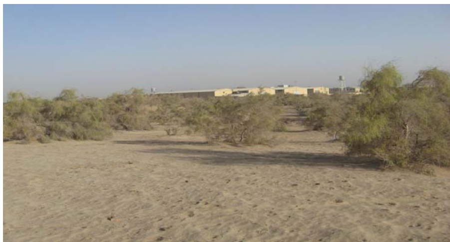
شکل ۲. تصویری از شاخه‌های دست‌کاشت منطقه