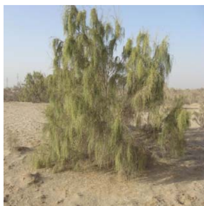
شکل ۵. تصویری از شاخه‌های شاداب در منطقه