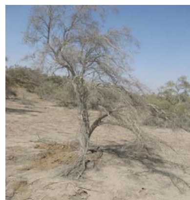
شکل ۳. تصویری از شاخه‌های خشکیده در منطقه