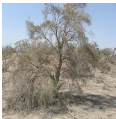
شکل ۴. تصویری از شاخه‌های نیمه شاداب در منطقه