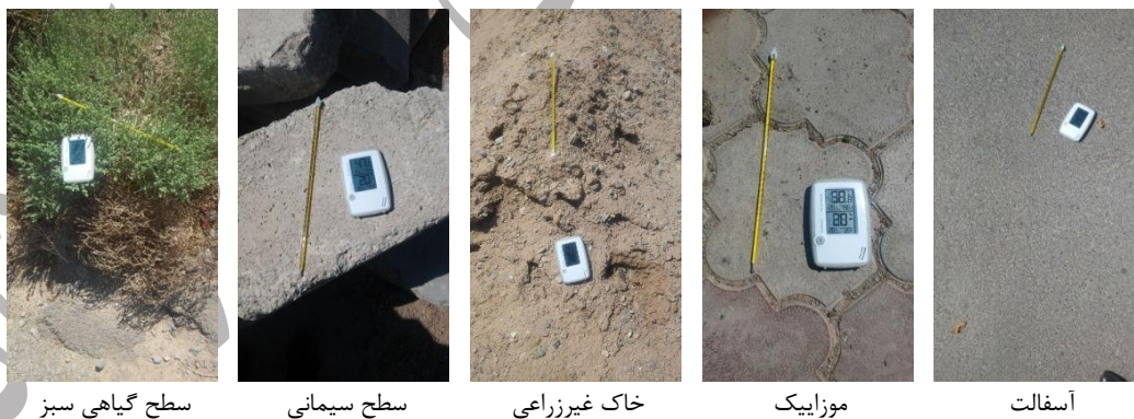
شکل ۱- اندازه‌گیری دمای سطوح مختلف زمین در محدوده شهر یزد - تیرماه ۱۳۹۵